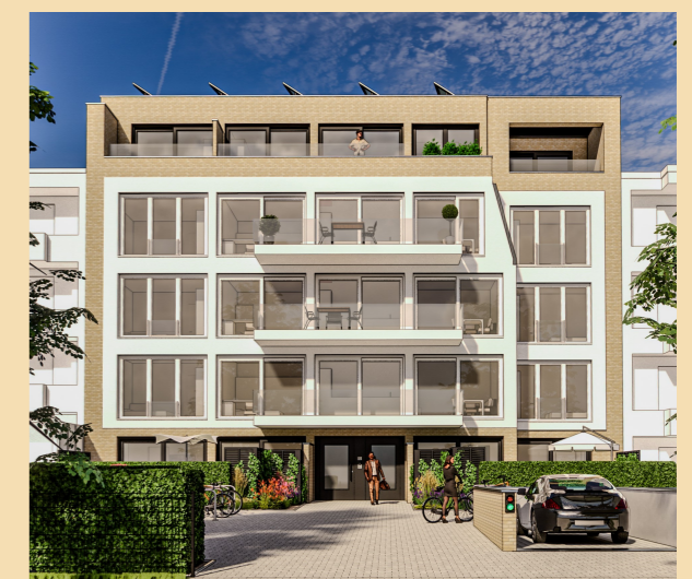
Neubauprojekt CLAS 69 - Claszeile 69, 14165 Berlin